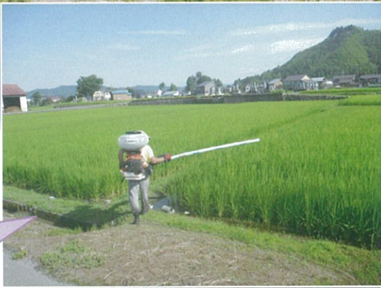
この写真は、穂肥まきをしていっています。

全国的に梅雨明けを迎え、これから本格的な夏に向けて暑さが増してきます。新潟県は7月21日に梅雨が明けたのに、むしろむしろとした暑い日が続いております。さて、魚沼市各地の田んぼでは7月の中旬から下旬にかけて、穂肥まき（ほごえまき）が始まりました。これは、稲に栄養を与えて太らせて、良い穂をつけさせる成長の最終段階です。栄養をつけた稲は秋の収穫時期に向けて、花が咲き、実をつけ、そして美味しい美味しいお米に成長していきます。